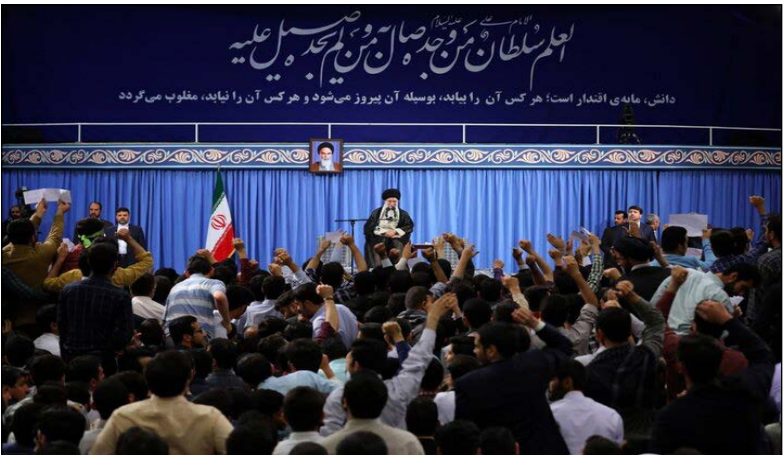
دانشگاه امام‌رضا (ع)؛ هر کس آن را بیاید، بوسه آن پیروز می‌شود و هر کس آن را بیاید، مغلوب می‌گردد

دانش‌بنیان نتیجه طبیعی چنین زنجیره‌ای است و می‌تواند کشور را از وابستگی اقتصادی رهایی بخشد. از منظر ایشان، دشمنان جمهوری اسلامی تنها با ابزارهای نظامی یا اقتصادی مقابله نمی‌کنند، بلکه یکی از اهداف اصلی آنان جلوگیری از پیشرفت علمی ایران است. توقف حرکت علمی، کاهش اعتماد به نفس نخبگان و وابسته نگه داشتن کشور از مهم‌ترین اهداف نظام سلطه معرفی می‌شود. بنابراین حفظ شتاب علمی کشور یک ضرورت امنیتی و تمدنی محسوب می‌شود.