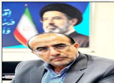
مدیر کل پیشگویی‌های امور دام آذربایجان شرقی خبر داد: