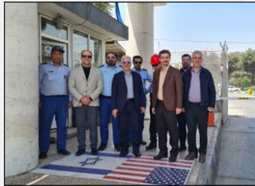
همزمان باعید سعید قربان: