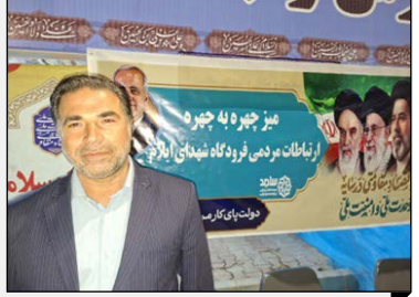
مدیر فرودگاه شهدای ایلام: