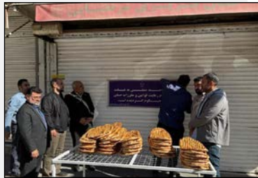
سخنگوی سازمان تعزیرات خبر داد: