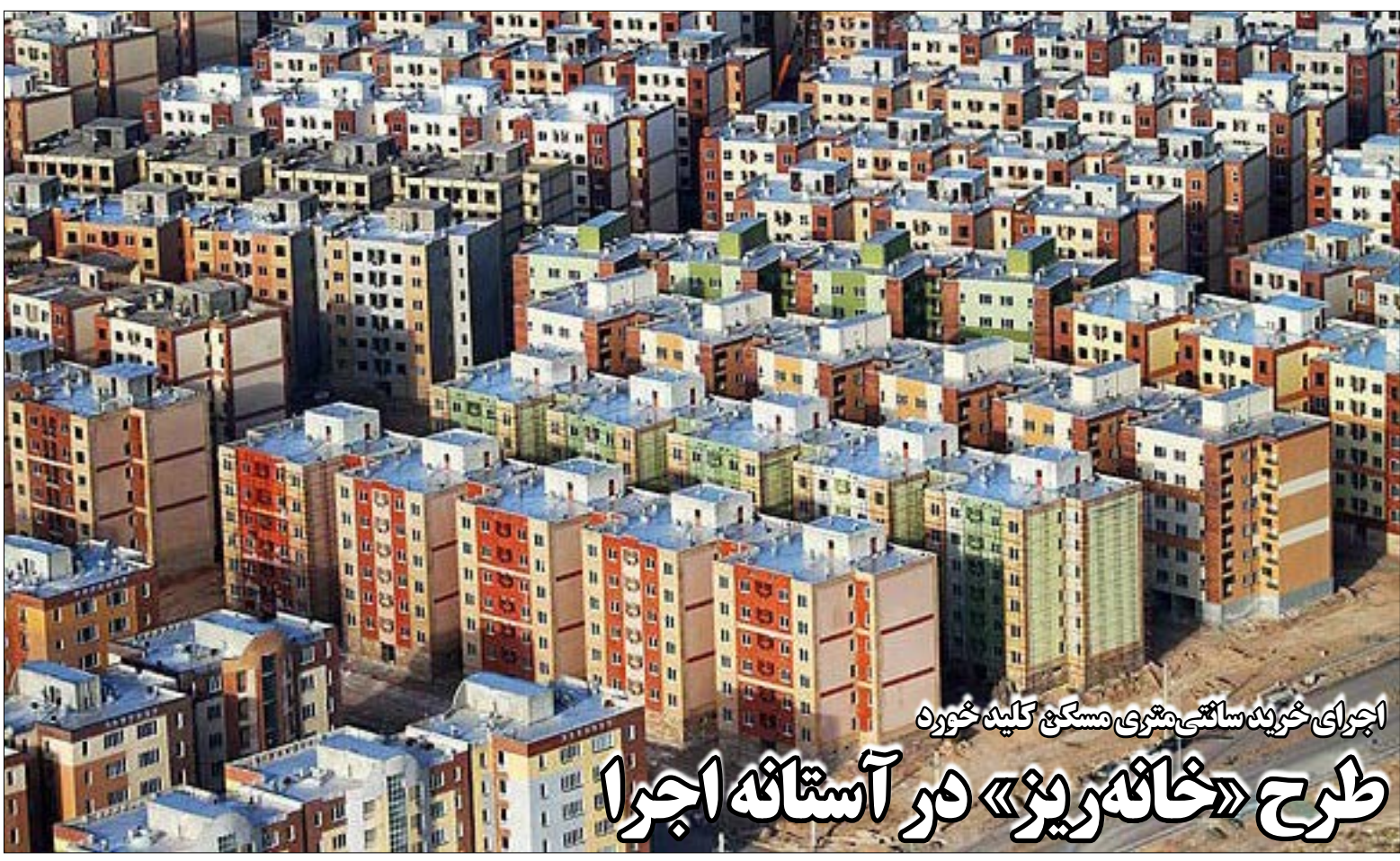
اجرای خرید مسکن شهری مسکن کلید خوره