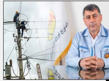
مدیر عامل شرکت توزیع نیروی برق مازندران خبر داد: