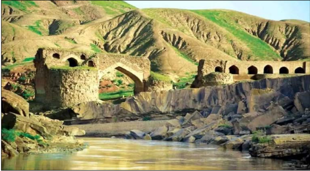
پل دختر و معمولا ن؛ از آبرساز ه‌های باستانی تا گذر گاه تاریخ

ایزدی در خصوص شیوه واگذاری بناهای تاریخی کشور از سوی صندوق احیاء و بهره برداری آثار تاریخی و ایسن موضوع که آیا این صندوق امکان واگذاری بناهای تاریخی نفایس از جمله کاروانسراهای ثبت جهانی شده را دارد و آیا بناهای نفیس را هم واگذار کرده است؟ افزود: صندوق احیاء و بهره برداری از آثار تاریخی کشور پیش از واگذاری بناها یا صدور فراخوان واگذاری آثار در حله نخست موضوع نفیس بودن این آثار را کمیته نفایس استعلام می‌کند و از آنجا که تسریع و تعجیل در واگذاری بناهای تاریخی و مورد واگذاری توسط صندوق احیاء و بهره برداری از اماکن تاریخی و فرهنگی کشور اهمیت دارد، همیشه درخواست آن‌ها خارج از نوبت