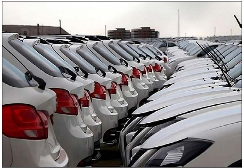
گروه اقتصاد ایران و جهان News.kasbokar@gmail.com

یک عضو کمیسیون صنایع و معادن مجلس با رد ادعای خودروسازان درباره افزایش قیمت به دلیل گرانی مواد اولیه، تاکید کرد: هیچ کمبودی در قطعات و ورق فولادی وجود ندارد و هر گونه افزایش قیمت خودرو غیر قانونی است.