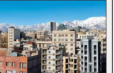
اعتبارات ودیعه مسکن به ۳۰۰ همت رسید

مدیرکل دفتر اقتصاد مسکن وزارت راه و شهرسازی گفت: سقف تسهیلات ودیعه مسکن نسبت به سال گذشته افزایش یافته که متقاضیان برای دریافت آن باید به سامانه طرح های حمایتی مراجعه کنند. رئیس رزبان مدیرکل دفتر اقتصاد مسکن وزارت راه و شهرسازی در رادیو اقتصاد از افزایش چشمگیر سقف تسهیلات کمک ودیعه مسکن مستأجران و تعیین سقف فردی تسهیلات به ۳۶۵ میلیون تومانی برای مصوبات شورای عالی مسکن و هیئت عالی بانک مرکزی اظهار داشت: سقف کلی تسهیلات کمک ودیعه مسکن که سال گذشته از ۸۰ به ۲۰۰ هزار میلیارد تومان (۳۰۰ همت) رسیده است، وی افزود: سال جاری مجدداً با رشد قابل توجهی به ۳۰۰ هزار میلیارد تومان (۳۰۰ همت) افزایش یافته بود، در از زمان آغاز پرداخت این تسهیلات (طی دو تاسه سال اخیر) تاکنون، جمعاً ۱۵۲ همت تسهیلات به مستأجران واجد شرایط پرداخت شده که از این میان، سال گذشته حدود ۲۰ همت آن تنها در یک استان، مدیرکل دفتر اقتصاد مسکن، سقف فردی این تسهیلات را بر اساس مصوبه هیئت عالی بانک مرکزی به شرح زیر اعلام کرد: شهر تهران: ۳۶۵ میلیون تومان، مراکز استان ها: ۲۸۰ میلیون تومان، سایر نقاط شهری: ۱۸۵ میلیون تومان، روستاها: ۷۵ میلیون تومان. رزبان تصریح کرد: این مصوبه به بانک های عامل ابلاغ شده و فرآیند ثبت نام متقاضیان ماندن سنوات گذشته صرفاً از طریق سامانه طرح های حمایتی مسکن انجام می شود.