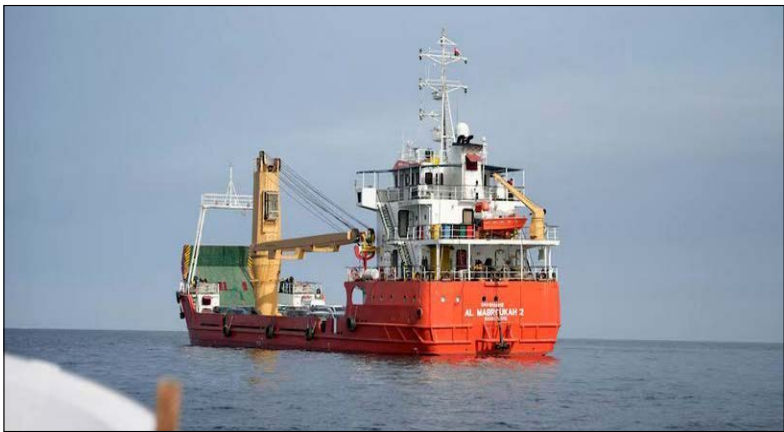
نفت برنت در واکنش به گمانه‌زنی‌ها پیرامون توافق میان ایران و آمریکا و نشانه‌هایی از کاهش تنش‌های منطقه‌ای، یکی از پرنوسان‌ترین هفته‌های سال را پشت سر گذاشت و حتی در یک روز بیش از ۱۲ درصد از ارزش خود را از دست داد.

افزایش سریع قیمت در ابتدای هفته ناشی از چسبیدن سرمایه‌گذاران به دارایی‌های امن انرژی محور بود؛ اما بازار به‌محض انتشار نخستین خبرهای قابل اعتماد از احتمال توافق دیپلماتیک و کاهش تهدیدهای نظامی، پرمیوم ریسک را از قیمت پاک کرد. در نهایت، نفت در پایان هفته در حوالی ۹۲ دلار فرار گرفت؛ یعنی تنها کمی پایین‌تر از سطح شروع هفته (۹۴.۳ دلار). اما در بطن این کاهش ظاهر آ محدود، بازار شاهد روزهایی پر از اضطراب، تغییر پوزیشن‌های سریع و معاملات با حجم بالا بود؛