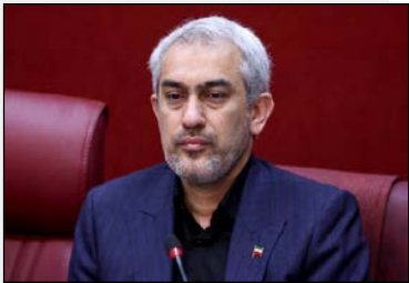
وزیر اقتصاد خبر داد: