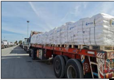
وزیر راه اعلام کرد: