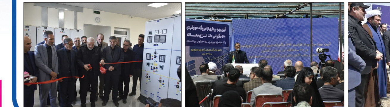
آیین بهره برداری از نیروگاه خورشیدی ۱۰۰ مگاواتی مانا انرژی در شهرستان محلات

وزیر نیرو در مراسم آغاز عملیات اجرایی نیروگاه ۵۵۰ مگاواتی پترو پارس ساهو گفت: حتی در شرایط جنگ تحمیلی بر کشور نیز توسعه صنعت برق متوقف نشد و در این زمینه پیشرو خواهیم کرد. عملیات اجرایی نیروگاه ۵۵۰ مگاواتی پترو پارس ساهو در زمینی با مساحت ۸۵ هکتار در حضور وزیر نیرو و جمعی از مسئولان ارشد کشوری و استانی در شهرستان ساهو کلید خورد. «عباس علی آبادی» در این مراسم ضمن قدر دانی از شرکت پترو پارس ساهو بابت سرمایه گذاری سوسمند در احداث نیروگاه ۵۵۰ مگاواتی گفت: اینکه امروز وارد حوزه توسعه انرژی های تجدیدپذیر در کشور شده ایم را باید به فال نیک کرد. وی افزود: حتی در شرایط جنگ تحمیلی بر کشور نیز توسعه صنعت برق فراموش نشد و در این زمینه پیشرو خواهیم کرد. وزیر نیرو تأکید کرد: تاکنون تمرکز بر انرژی های فسیلی بوده اما توجه به توسعه عصر انقلاب صنعتی چهارم، محیط زیست دیگر پاروش های سنتی به ما اجازه نخواهد داد تا اقدام کنیم، بنابراین توسعه تجدید پذیرها برای ضروری به نظر می رسد. بنا بر این گزارش پروژه عظیم نیروگاه ۵۵۰ مگاواتی پترو پارس ساهو که با هدف تأمین برق پایدار و تقویت زیرساخت های انرژی کشور طراحی شده است، گامی مهم در مسیر توسعه صنعتی و اقتصادی منطقه به شمار می رود. وزیر گاه پترو پارس ساهو با ظرفیت ۵۵۰ مگاوات، نه تنها نیازهای برق استان مرکزی را بر طرف می کند، بلکه به عنوان یکی از پروژه های کلیدی در شبکه سراسری برق کشور نقش آفرینی خواهد کرد. این نیروگاه با استفاده از فناوری های پیشرفته و رعایت استانداردهای زیست محیطی، نمادی از توسعه پایدار در صنعت انرژی ایران است. این پروژه بخشی از برنامه های استراتژیک وزارت نیرو برای تأمین انرژی پاک و پایدار در کشور است.