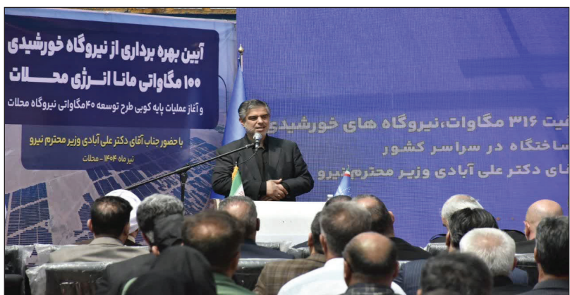
بیت ۳۱۶ مگاوات، نیروگاه های خورشیدی ساخته در سراسر کشور نای دکتر علی آبادی وزیر محترم نیرو

اراک خبرنگار کسب و کار، با یکبار حضور وزیر نیرو و استاندار و کمیته ای از مدیران ارشد کشوری و استانی، نیروگاه خورشیدی ۱۰۰ مگاواتی مانا انرژی به بهره برداری رسید و عملیات پایه کوپی طرح توسعه ۴۰ مگاواتی این نیروگاه نیز آغاز شد. در این مراسم که در شهرستان محلات برگزار شد، همچنین آیین بهره برداری همزمان از ظرفیت ۳۱۶ مگاوات نیروگاه های خورشیدی در ۴۰ ساختگاه در سراسر کشور نیز برگزار شد. نیروگاه خورشیدی مانا انرژی با ظرفیت ۱۰۰ مگاوات به عنوان یکی از بزرگ ترین نیروگاه های خورشیدی کشور، نقش مؤثری در تأمین پایدار انرژی ایجاد اشتغال و توسعه اقتصادی منطقه ایفا خواهد کرد. این پروژه با استفاده از فناوری های نوین و به همت متخصصان داخلی، توانسته گامی مهم در مسیر تحقق اهداف زیست محیطی و کاهش وابستگی به سوخت های فسیلی بردارد. سرمایه گذاری در انرژی های پاک، نه تنها پاسخ به نیازهای انرژی کشور است، بلکه بخشی از تعهد ما در برابر آیندگان و حفاظت از محیط زیست نیز محسوب می شود. پروژه مانا انرژی با یک، با همکاری گسترده نهاد های دولتی و بخش خصوصی، به عنوان الگویی موفق در اجرای پروژه های انرژی خورشیدی مطرح شده و پیش بینی می شود نقش مهمی در ارتقای ظرفیت تجدیدپذیر کشور ایفا کند.