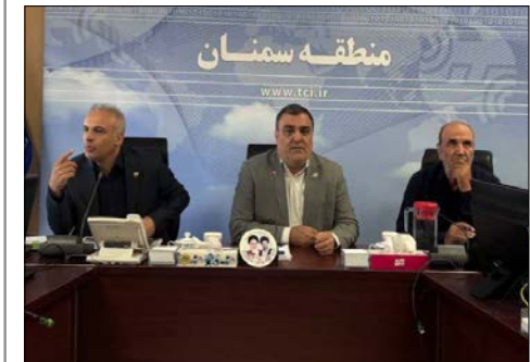
مدیرعامل شرکت گاز استان ایلام در جریان بازدید از مراکز سلامت روان محلی در شهرهای مختلف استان، با اشاره به رویکرد مشارکتی این مراکز اظهار داشت: مراکز سلامت روان محلی با شناسایی چالش‌های روانی-اجتماعی در سطح محلات، خدمات خود را بر پایه نیازسنجی و مشارکت شهروندان ارائه می‌دهند. آموزش مهارت‌های مقابله با استرس، برگزاری کارگاه‌های ارتقای تاب‌آوری و تدوین پروژه‌های مشارکتی برای رفع مشکلات محله‌ای، از اولویت‌های این مراکز است.

گذاری شده در استان سمنان خبر داد. مهندس دارانی به توسعه فیبرنوری در این استان اشاره و خاطر نشان داشت: ۵۳۸ طرح از این پروژه‌ها در حوزه توسعه فیبرنوری در همه شهرستان‌های استان اجرایی و افتتاح خواهد شد که نقش مهمی در آینده دیجیتال استان خواهد داشت و نقش ویژه‌ای به توسعه متوازن استان دارد. مدیر مخابرات استان به پوشش ۱۰۰ درصدی آزادراه حرم تاحرم در محدوده جغرافیایی استان اشاره و تصریح داشت: البته همچنان ممکن است نقاط کور و گپ‌هایی از بخش‌های کوچکی در این مسیر باشد. مهندس دارانی در ادامه تشریح عملکرد یکساله خود با تأکید بر مخابرات استان سمنان تنها شرکتی در زیرمجموعه مخابراتی که خودگردان می‌باشد از روند رو به رشد مخابرات استان خبر داد و افزود: اگر بتوانیم در حوزه سرویس‌های هوشمندسازی، هوش