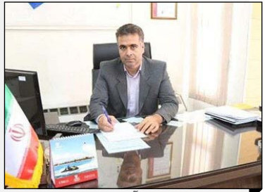
مدیرعامل شرکت آب و فاضلاب استان ایلام: