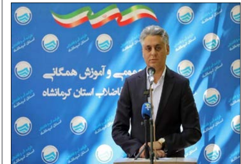
مدیرعامل شرکت آب و فاضلاب استان کرمانشاه در جریان بازدید از مراکز سلامت روان محلی در شهرهای مختلف استان، با اشاره به رویکرد مشارکتی این مراکز اظهار داشت: مراکز سلامت روان محلی با شناسایی چالش‌های روانی-اجتماعی در سطح محلات، خدمات خود را بر پایه نیازسنجی و مشارکت شهروندان ارائه می‌دهند. آموزش مهارت‌های مقابله با استرس، برگزاری کارگاه‌های ارتقای تاب‌آوری و تدوین پروژه‌های مشارکتی برای رفع مشکلات محله‌ای، از اولویت‌های این مراکز است.