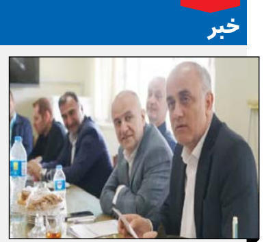
مدیر عامل شرکت گاز مازندران تأکید کرد:

دکتر تقوی در ادامه بیان داشت: در استان مازندران حدود ۲۵۰ بیمار اوتیسم داریم که هر یک از سازمان‌های بیمه گر نسبت به نشان دار کردن و