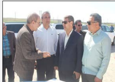
معاون مهندسی و ساخت اداره کل راه و شهرسازی ایلام: