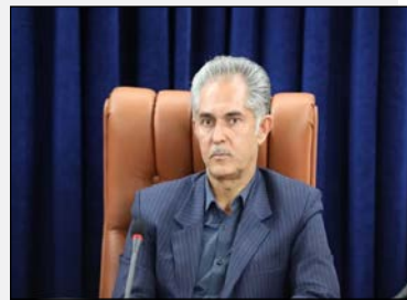
مدیر کل راه و شهرسازی ایلام: