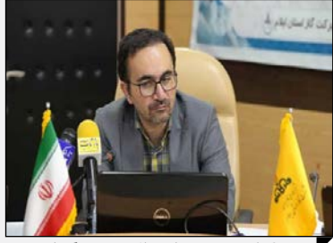
در ۹ ماهه نخست امسال صورت گرفت: