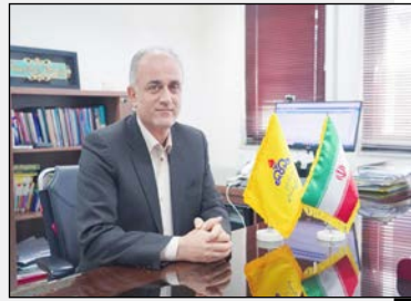
مدیرعامل شرکت گاز مازندران: