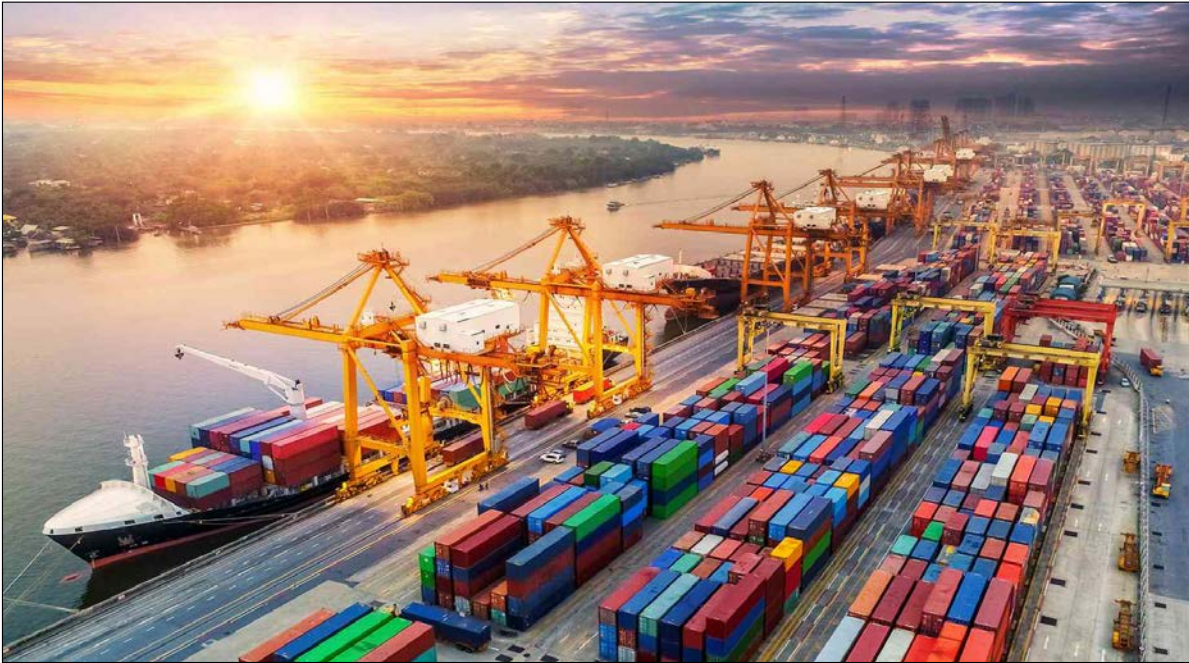
انبارهای گسترده صادراتی در بندر امام خمینی، تهران.

این نشست باهدف بررسی فرصت‌ها و چالش‌های تجاری بین دو کشور و ایجاد پل ارتباطی بین فعالان اقتصادی برگزار شد تا از این طریق مسیرهای جدیدی برای توسعه همکاری‌های دوجانبه باز شود. در این نشست،