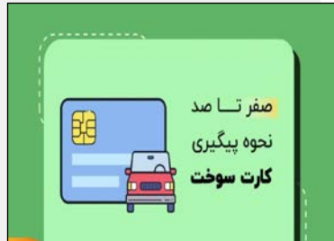
مدیر منطقه اردبیل خبر داد: