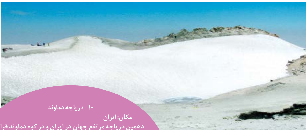
۱۰- دریاچه دماوند