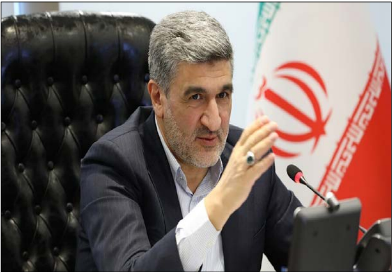
گروه اقتصاد ایران و جهان News.kasbokar@gmail.com