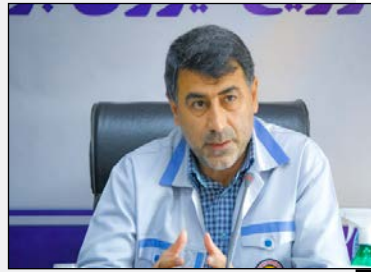
مدیرعامل شرکت توزیع نیروی برق مازندران مطرح کرد: