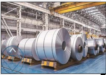
جایگاه دهمی ایران حفظ شد