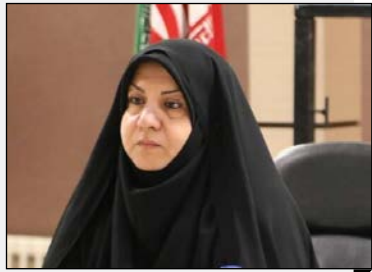
مدیر کل بهزیستی مازندران: