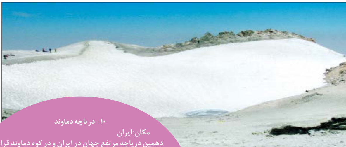
۱۰- دریاچه دماوند