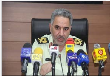
سردار سلمانی خبر داد: