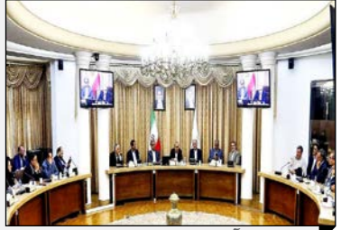
استاندار آذربایجان شرقی: