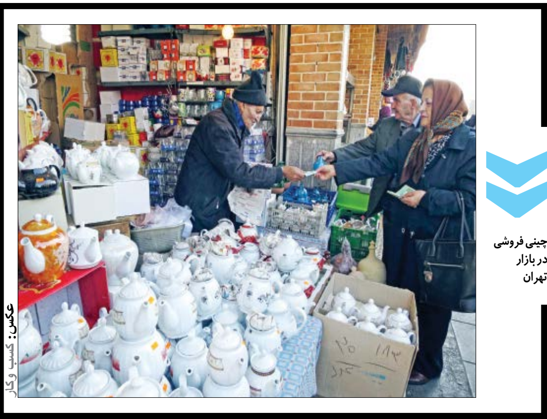
عکس: کسب و کار