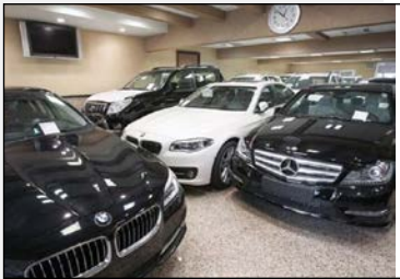
دیوان محاسبات اعلام کرد: