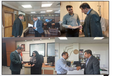
البرز - در راستای کسب و رتبه نخست در عملکرد، دبیر نامه‌های استان البرز: