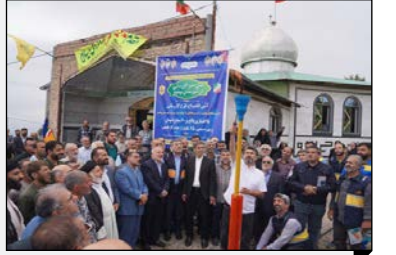
مدیر عامل شرکت گاز مازندران اعلام کرد: