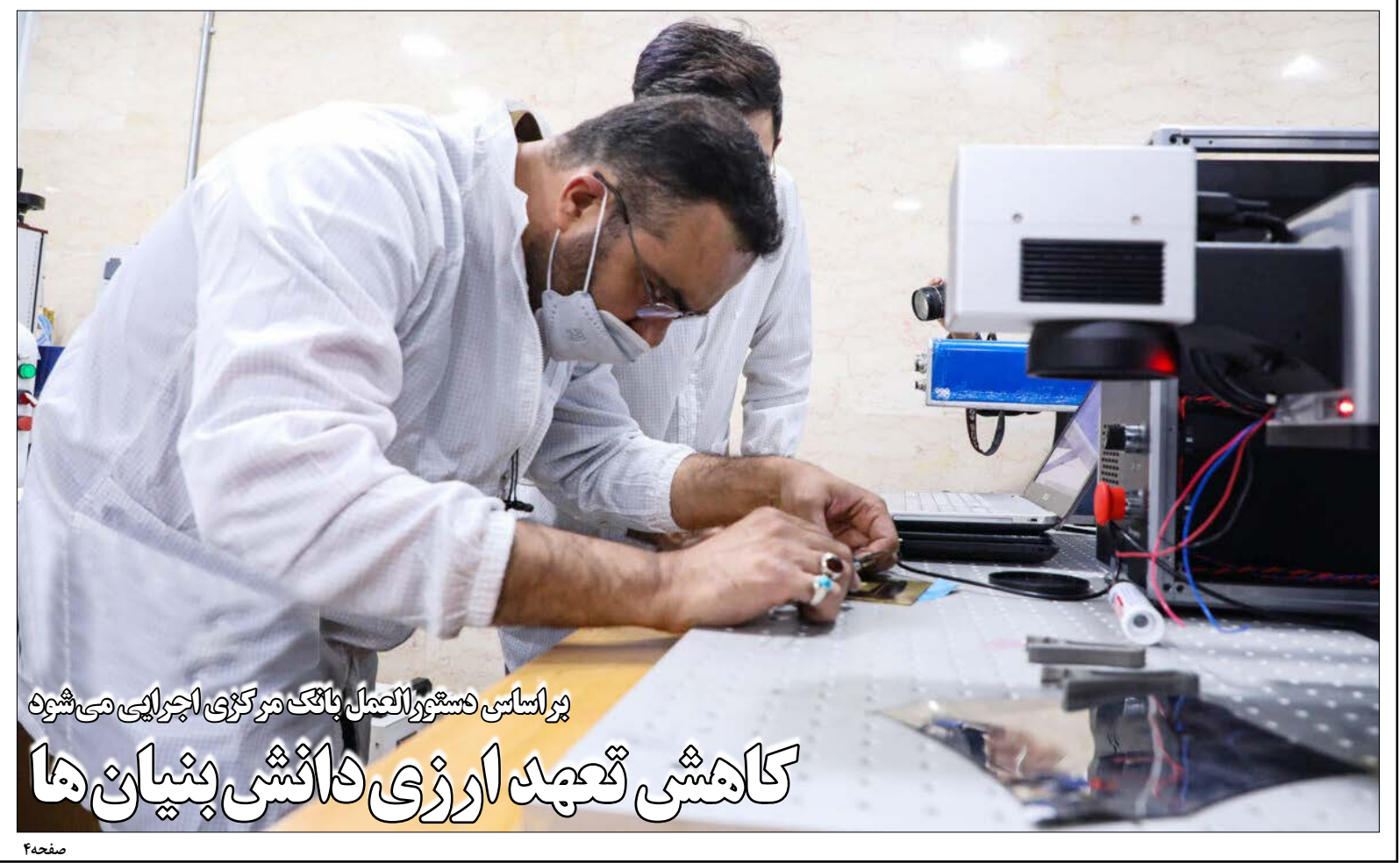
پرواستانی دستورالعمل بانک مرکزی اجرایی می شود