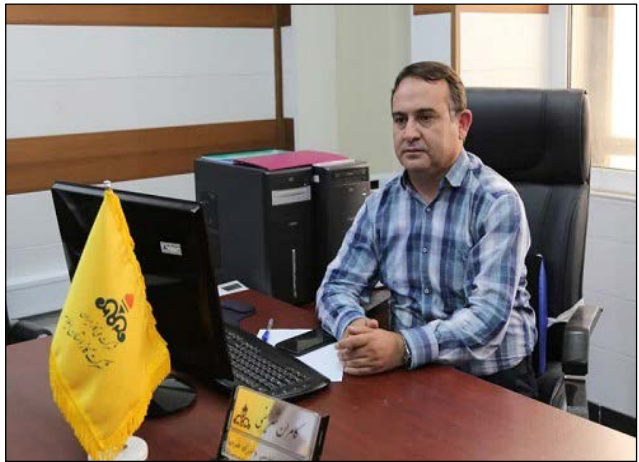
مدیر امور مهندسی و اجرای طرح های شرکت گاز ایلام از پایداری گاز در مناطق شهری و روستایی استان خبر داد.