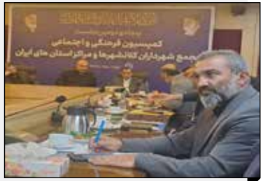
سرپرست سازمان فرهنگی، اجتماعی و ورزشی شهرداری اراک خبر داد: