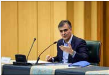
تالار مبادلات ارز توافقی افتتاح می‌شود