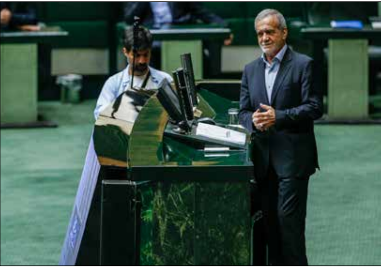
گروه اقتصاد ایران و جهان News.kasbokar@gmail.com

رئیس‌جمهور در مراسم بررسی صلاحیت و برنامه‌های وزیران پیشنهادی دولت چهاردهم گفت: دولتی که امروز به مجلس معرفی شده، «دولت وفاق ملی» است و دولت وفاق ملی، خود را دولت همه‌ملت ایران می‌داند.