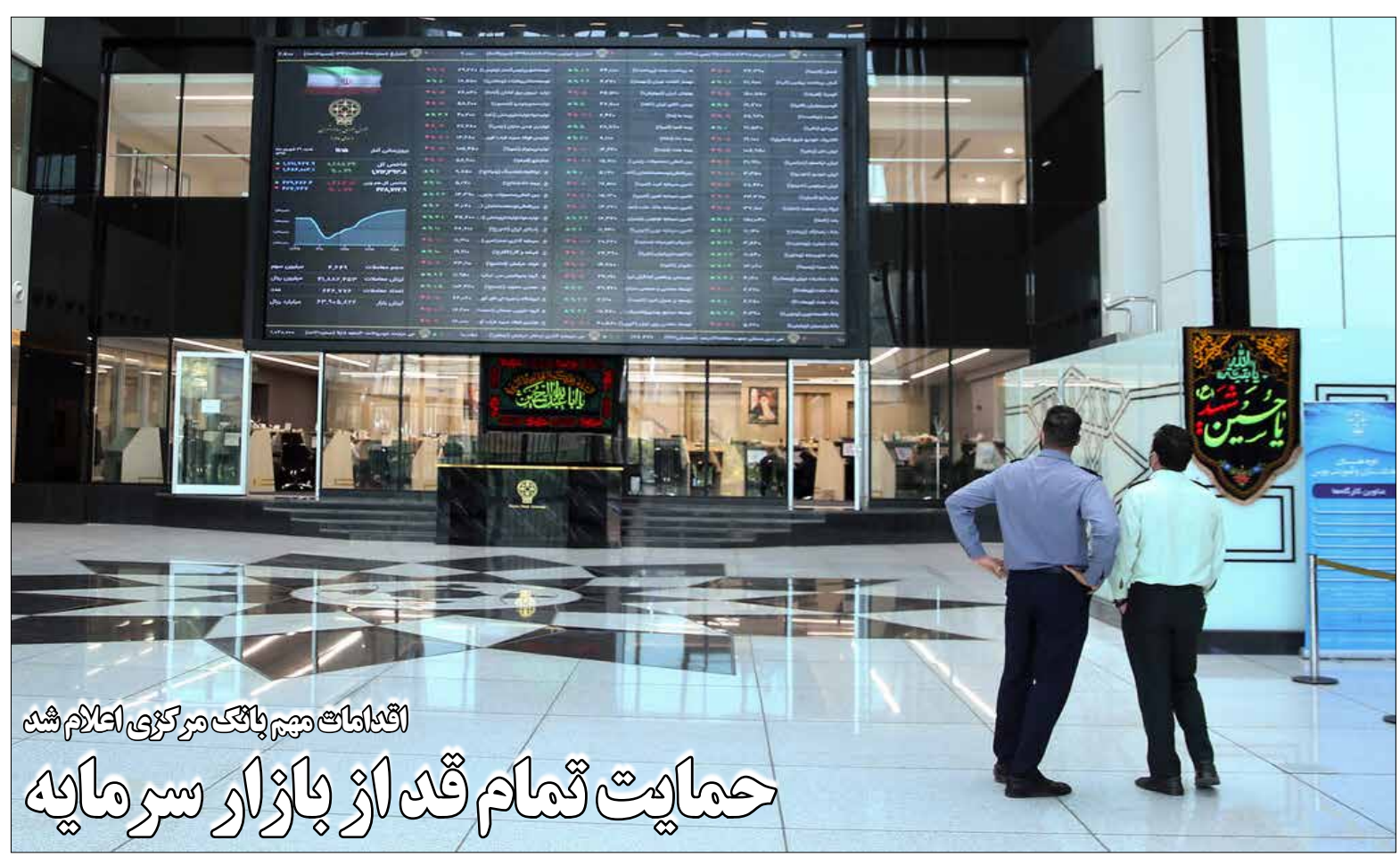
اقدامات مهم بانک مرکزی اعلام شد