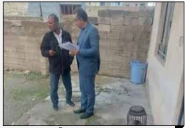
مدیر شرکت ملی پخش فرآورده‌های نفتی منطقه ایلام: