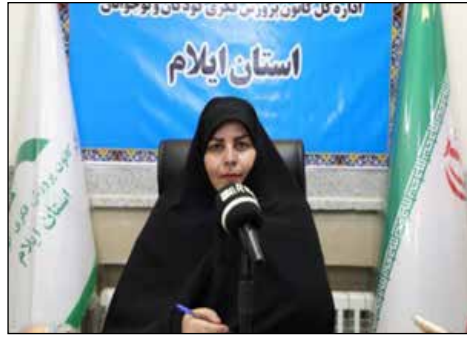
ایلام - مدیرکل کانون پرورش فکری کودکان و نوجوانان ایلام از عضویت بیش از ۹ هزار نفر در کانون خبر داد و گفت: ۱۱ هزار و ۹۲۲ جلد کتاب در چهار ماهه اول اسامال به اعضای مراکز کانون در این استان امانت داده شده است.

مدیرکل کانون پرورش فکری کودکان و نوجوانان ایلام با اشاره به