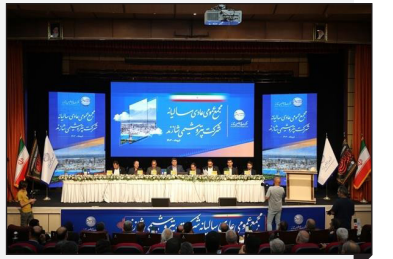
تایید عملکرد شاراک در مجمع عمومی عادی سالیانه

شازند جزو بهترین شرکت های پتروشیمی سید محسن موسوی: مجمع عمومی شرکت پتروشیمی شازند با حضور ۸۱.۵۴ درصدی سهامداران حقوقی و حقیقی روز جمعه ۲۹ تیر ماه در مرکز همایش های هتل المپیک تهران برگزار و عملکرد این شرکت در سال مالی ۱۴۰۲ مورد تأیید سهامداران قرار گرفت.