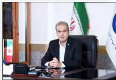
مدیر عامل آب وفاضلاب مازندران خبر داد:

پیشرفت ۷۰ درصدی پروژه آبرسانی به مجتمع ولیسده امل مدیر عامل آب وفاضلاب مازندران گفت: پروژه آبرسانی به این مجتمع ولیسده در شهرستان امل با بهره مندی ۵۵۰۰ نفر ۷۰ درصد پیشرفت فیزیکی در حال اجراست.