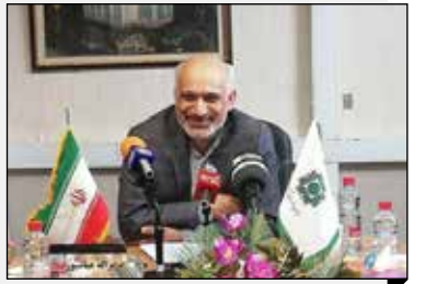
مدیر کل امور مالیاتی ایلام: