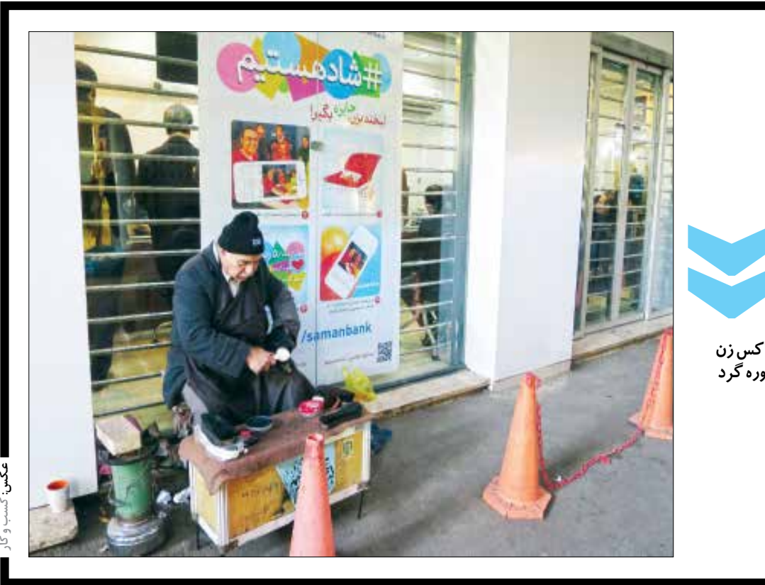
واکس زن دوره گرد

مورد نیاز بدن را تامین می‌کند و مانع خستگی است. لفل دلمه‌ای یا پرتقال: خانواده ویتامین C باعث شادابی بدن و ذهن می‌شود زیرا این ویتامین میزان ترشح کورتیزول را کنترل می‌کند. یک فنجان لفل دلمه‌ای خرد شده ۲ برابر نیاز روزانه ویتامین C شما