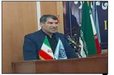
مدیر کل تامین اجتماعی ایلام: