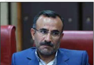
مدیرکل بنیاد مسکن ایلام:

وی از مردم خواست تا هر نوع شکستگی و اتفاقات رخ داده در سطح شهر و روستاها را با تماس سامانه ۱۲۲ اطلاع دهند. مدیرعامل شرکت آب و فاضلاب گلستان با اشاره به هفته صرفه‌جویی در مصرف آب و برق، از اجرای پویش ۵۰ لیتر ذخیره سازی آب به ازای هر خانوار خبر داد و اظهار داشت: این پویش با کمک شهروندان و مردم به عنوان یک الگو به کشور معرفی شود تا استان گلستان به عنوان یک نماد برای کشور باشد.