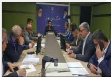
مدیر کل تعاون روستایی ایلام: