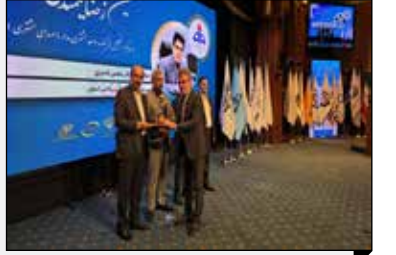
مدیر برنامه ریزی هلدینگ پتروپالایش اصفهان تأکید کرد: