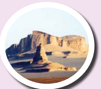
کویر لوت و کلوت‌ها

چابهار، تنها بندر اقیانوسی ایران، در انتهای جنوب شرقی ایران و در مجاورت اقیانوس هند قرار دارد. این بندر در تمام فصول سال هوای معتدلی دارد. از زیبایی‌های چابهار می‌توان جنگل حرا، سواحل سنگی، انجیر معابد و کوه‌های مریخی را نام برد.