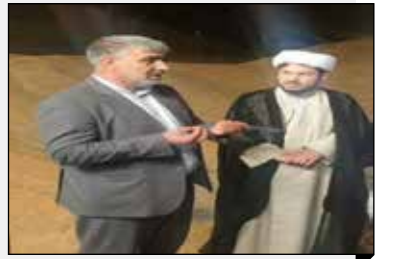
مدیر کل تعاون روستایی ایلام: