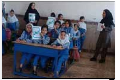
مدیر کل استاندارد ایلام: