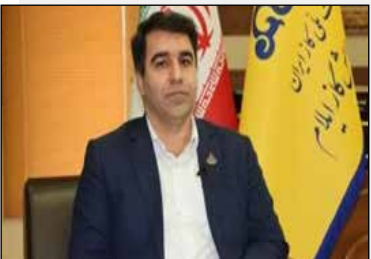
رئیس سازمان مدیریت بحران کشور:

ر نظر گرفته در راستای بهسازی و نوسازی، بهینه سازی و ارتقا سطح بهداشت و صنعتی نمودن کشتار گاه دام شهرداری اراک، اخیراً اقدام به تهیه و خرید ۳ سری دستگاه بردنتی بیش سرد گوشت شامل « ۳ دستگاه اواپراتور، ۳ دستگاه کندانسور، ۳ دستگاه کمپرسور » جهت بهره برداری در کشتار گاه نموده است.