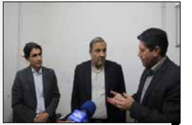
مدیر کل صمت ایلام: