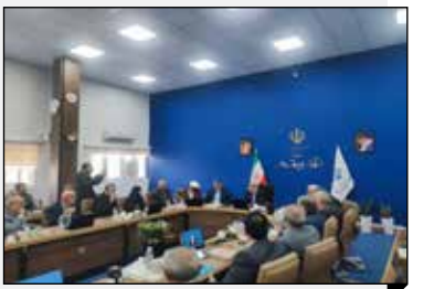
استاندار مازندران در جمع اعضای خیرین کتابخانه ساز استان: