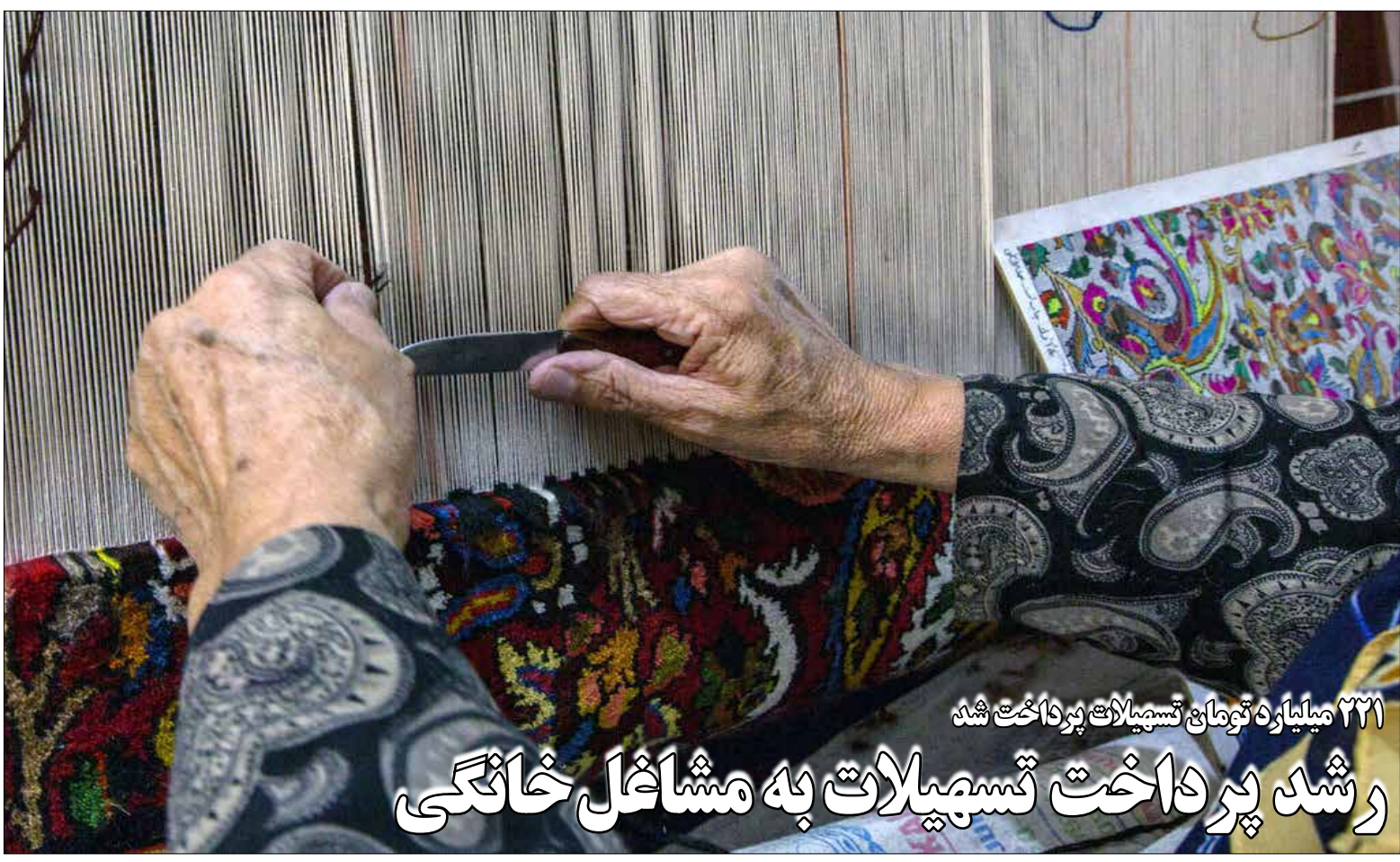
۲۲۱ میلیارد تومان تسهیلات پرداخت شد