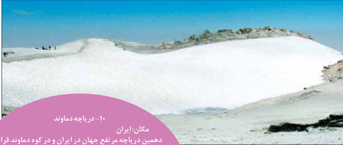
۱۰- دریاچه دماوند

پوکوانتیکادر کوه‌های آندس مرز بین شیلی و بولیوی و در ارتفاع ۵۷۵۰ متری از سطح دریا، در قله یک کوه آتش فشان غیر فعال قرار دارد. زمین‌شناسان از این دریاچه به عنوان سرزمین عجایب یاد می‌کنند و آن را مکانی ایده‌آل برای بررسی اشکال مختلف زندگی در خارج از کره زمین و در مریخ می‌دانند. به اعتقاد آنها این دریاچه‌ها سهم بزرگی در زمینه‌های علمی خواهند داشت.