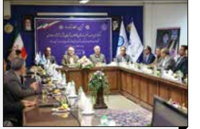
با حضور رئیس جمهور انجام شد: