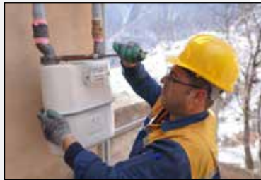
تحقق ۱۰۰ درصدی جذب اشتراک گاز در مازندران؛